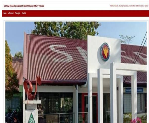
Gambar 2. Tampilan Menu Utama

Certainty Factor . Hasil terhadap penelitian ini adalah jenis minat vokasi pada siswa dan konsultasi untuk siswa. Setelah dilakukan pengujian dan perhitungan tingkat akurasi sistem, maka didapatkan tingkat akurasi yang baik dari hasil perhitungan sistem dengan keputusan pakar sebesar 80% dari 4 data pengujian. Berdasarkan tingkat akurasi dari hasil identifikasi terhadap sistem, maka penelitian ini sangat tepat dalam identifikasi minat vokasi pada siswa.